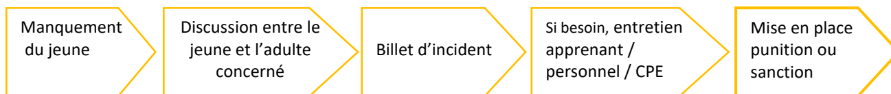
Schéma du fonctionnement des différents interlocuteurs autour d'une sanction disciplinaire

L'ensemble des personnels de l'établissement privilégie le dialogue et la recherche de solutions à caractère éducatif ou pédagogique avant toute mesure visant à punir ou à demander une sanction vis-à-vis d'un apprenant. Des mesures de prévention, éducatives, peuvent être mises en place dans un premier temps.